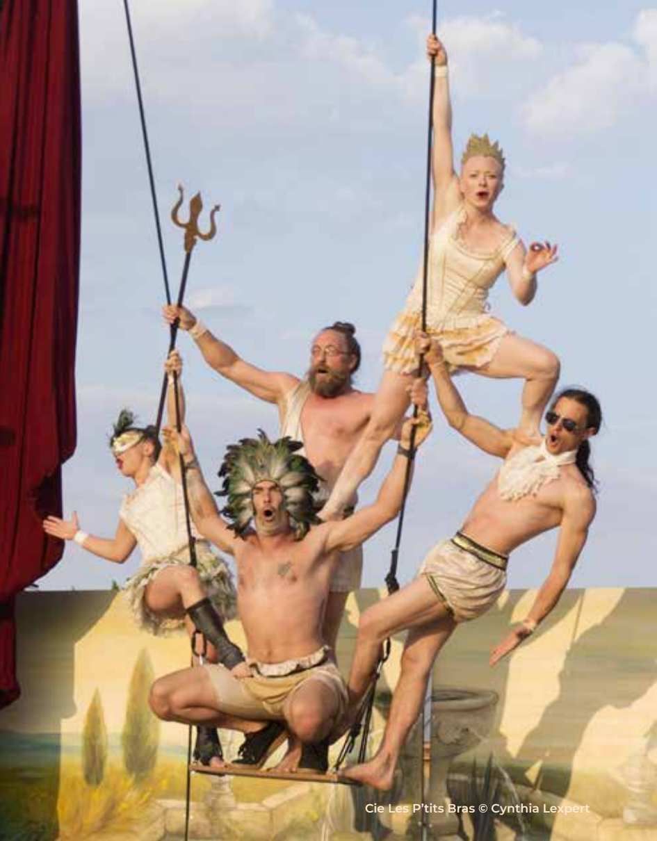
Cie Les P'tits Bras