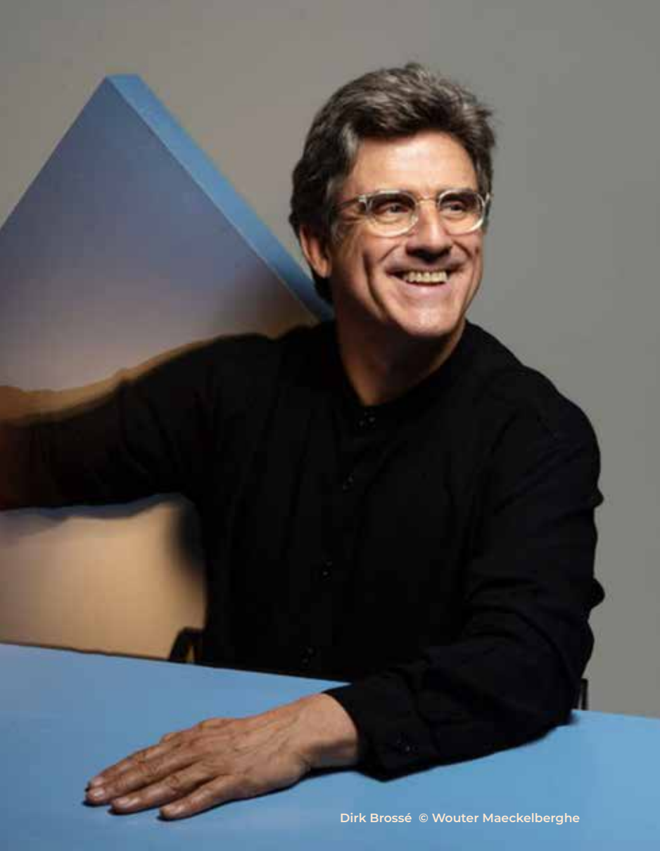
Dirk Brossé