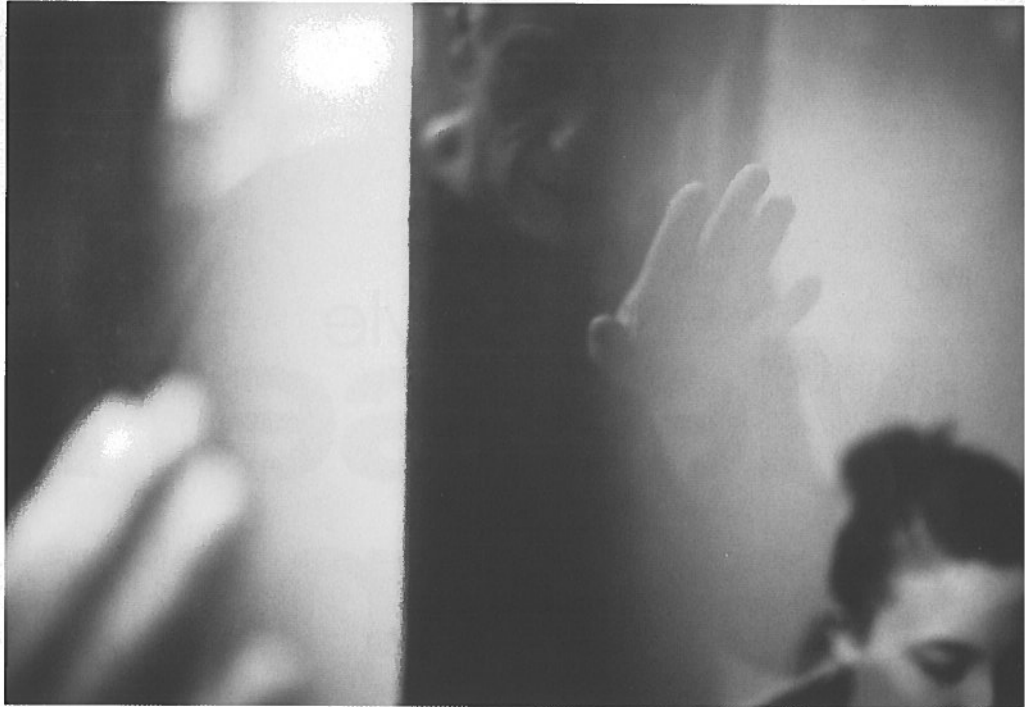
ONDER - Groepsportret theater Zuidpool