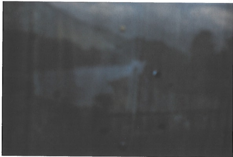
Vrij werk: reeks 6 isola comacina © Koen Broos