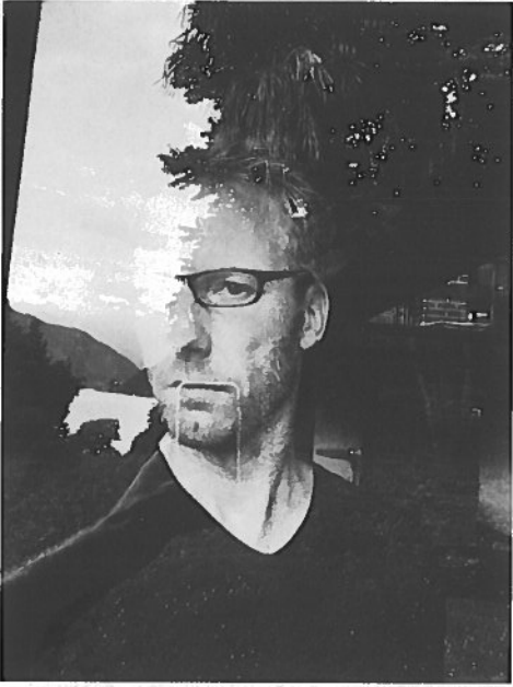
BOVEN - Zelfportret, gemaakt met een iPhone op Isola Comacina