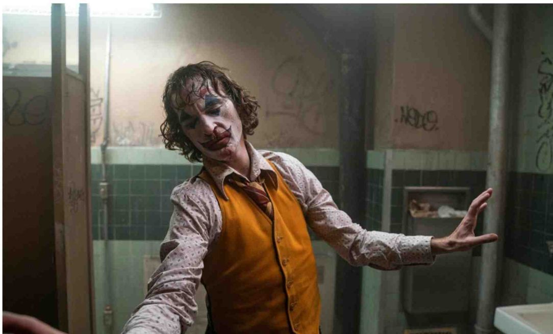
Met zijn angstaanjagend onmenselijke vertolking als Joker is Joaquin Phoenix topfavoriet in de categorie 'beste acteur'.